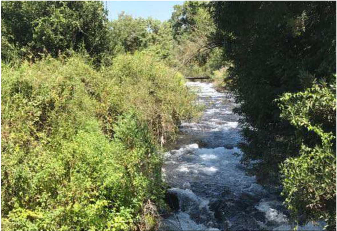
La Reserva Natural de Tel Dan