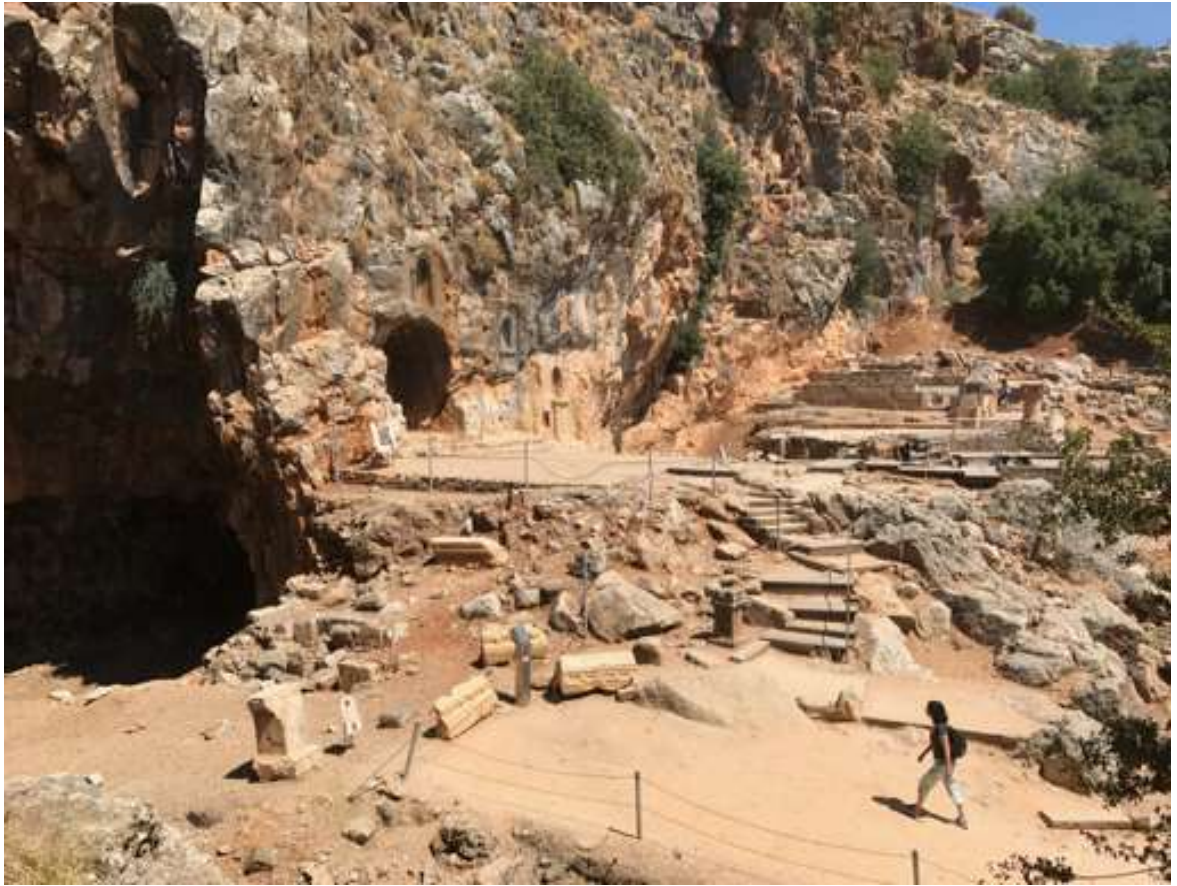
Reserva Natural Nahal Hermon – Banias (Cesarea de Filipino)