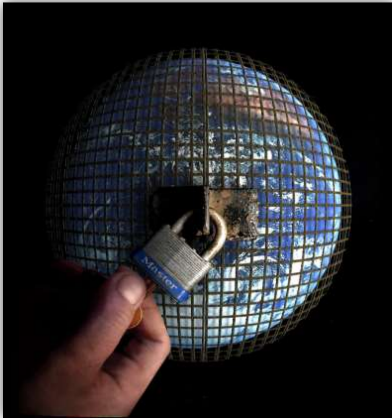
El mundo de Eclesiastés