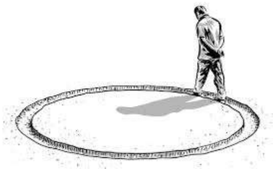
La perspectiva acerca del tiempo de Eclesiastés