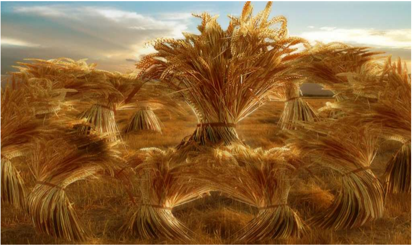
El sueño de las gavillas